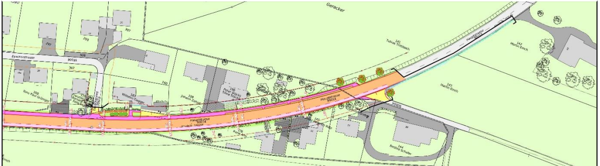
Abbildung 2, Übersicht Projektperimeter Strassen- und Werkleitungsbau, Teil Ost

Bitte entschuldigen Sie die Unannehmlichkeiten bezüglich Zufahrt erschwernisse und Lärmimmissionen während der Bauarbeiten.