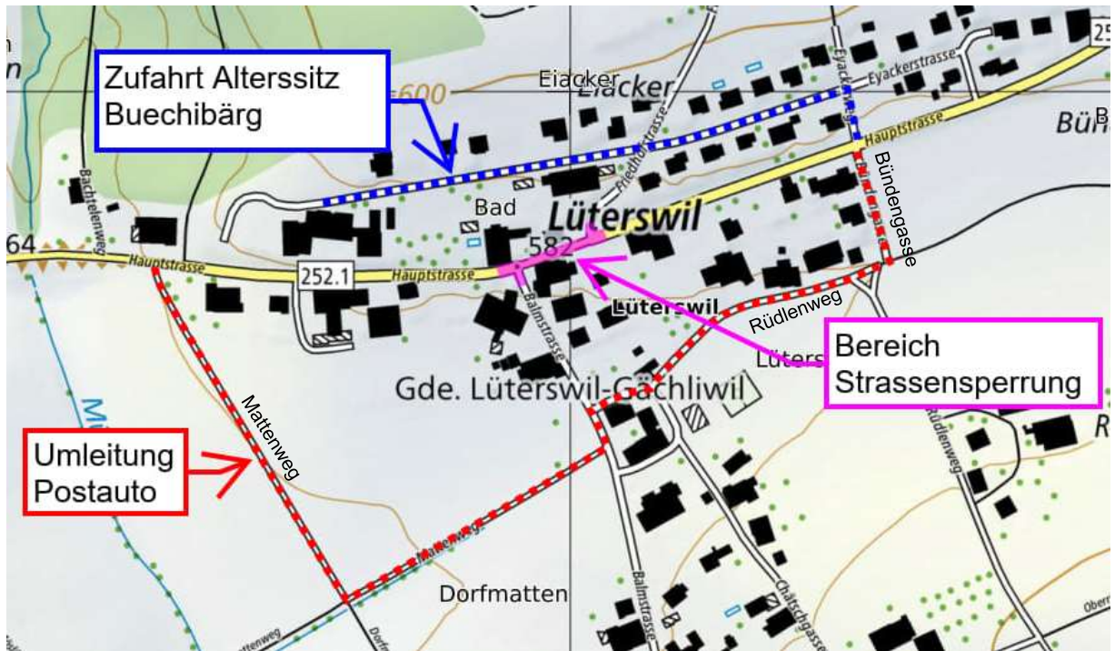
Abbildung 2, Umleitung Postauto und Zufahrt Alterssitz Buechibärg

Bitte entschuldigen Sie die Unannehmlichkeiten bezüglich Zufahrterschwernisse und Lärmimmissionen während der Bauarbeiten.